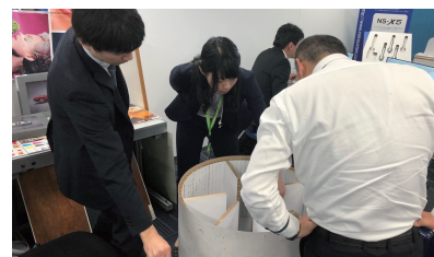
実際にリボードのサンプルを利用し、作成した後の確認や作図の注意点などをご説明いたします。